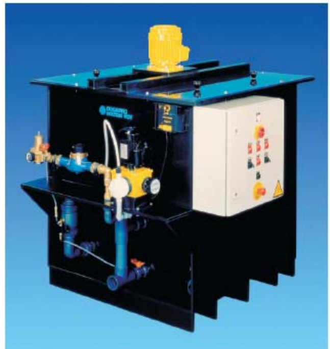
Polypack® AE 1500