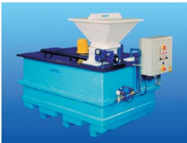
Polypack® AP 1340

(*AP430 version: palletank med 2 kammerer.