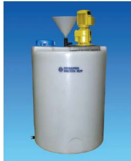
Polypack® M 500